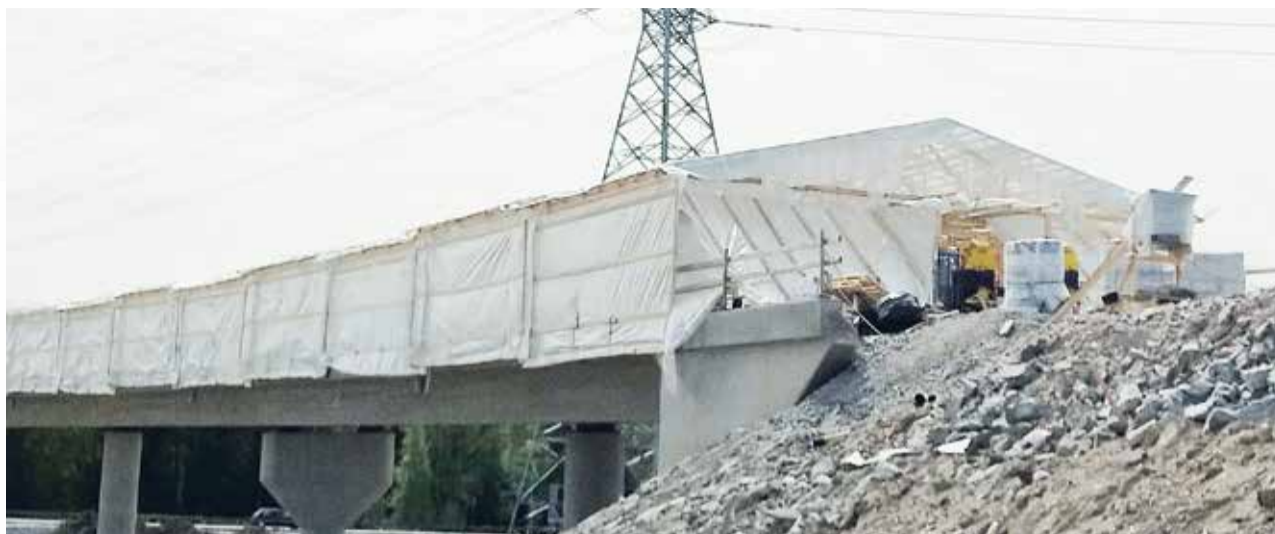
Sääsuoja Kehä III / VT7 liittymä, Helsinki.

SUOJAA RAKENNUSKOHTEESI SÄÄOLOSUHTEILTA HELPOSTI, TURVALLISESTI JA EDULLISESTI.