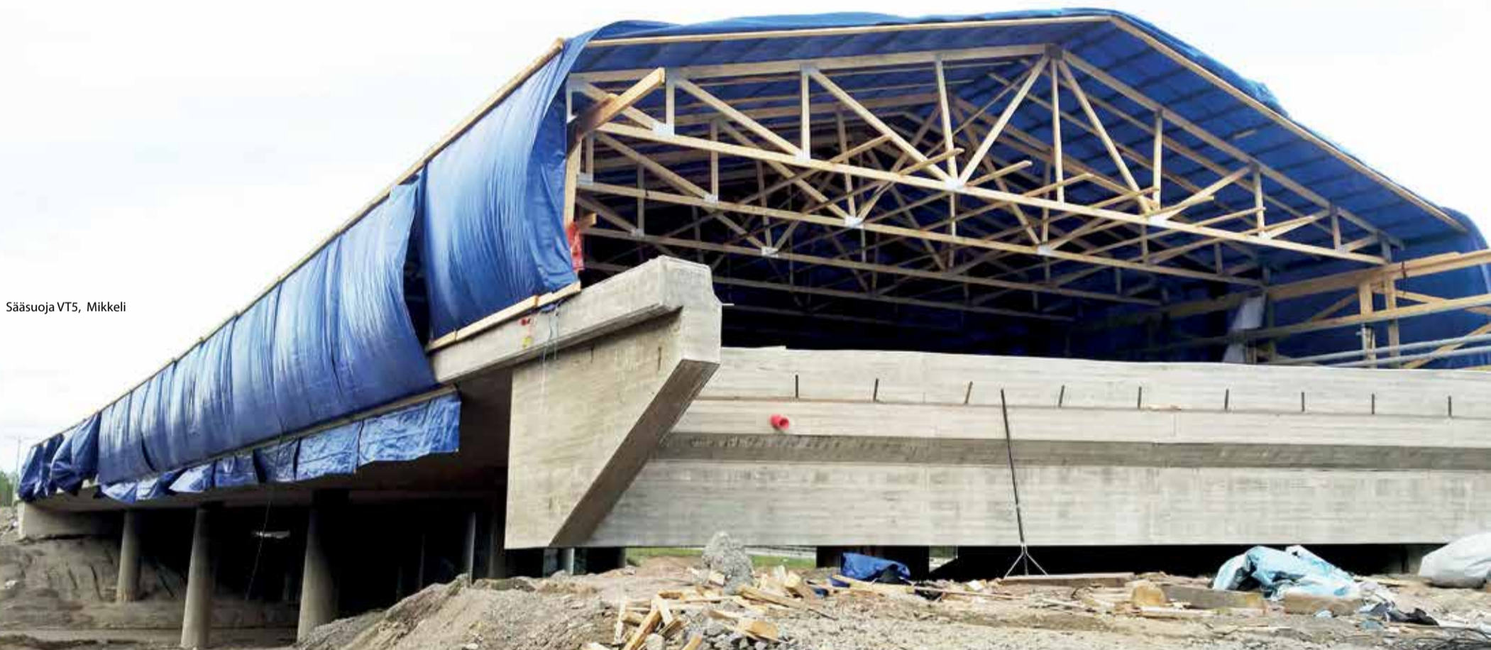
Sääsuoja VT5, Mikkeli

Modernia sillanrakennusta silmällä pitäen Sepa on kehittänyt sääsuojamallin, joka valmistetaan ennalta ja asetetaan rakennuspaikalla paikalleen vaivatta. Sääsuoja suunnitellaan aina asiakkaiden tarpeiden mukaan.