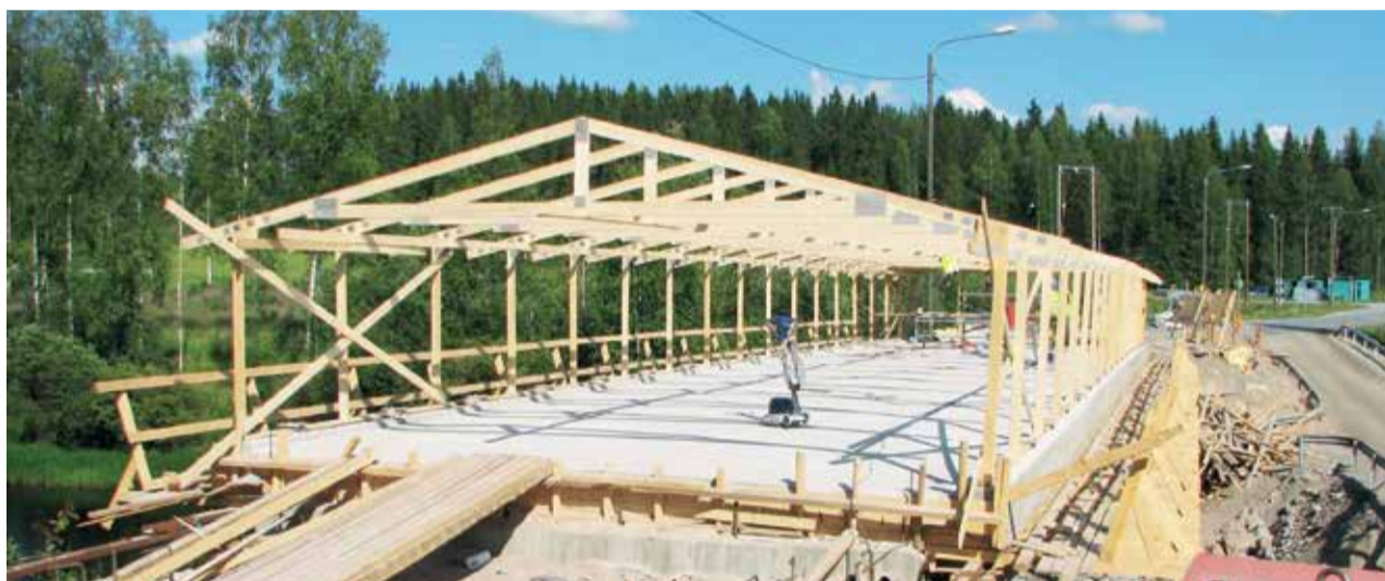
Sääsuoja suunnitellaan yksilöllisesti jokaisen kohteen vaatimusten mukaisesti.