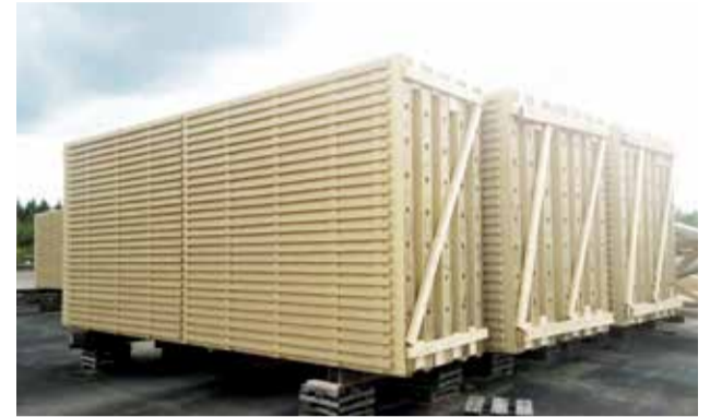
Meluste valmiina toimitukseen. Sepan melusteissa päästään jopa 6,5 metrin jänneväleihin.