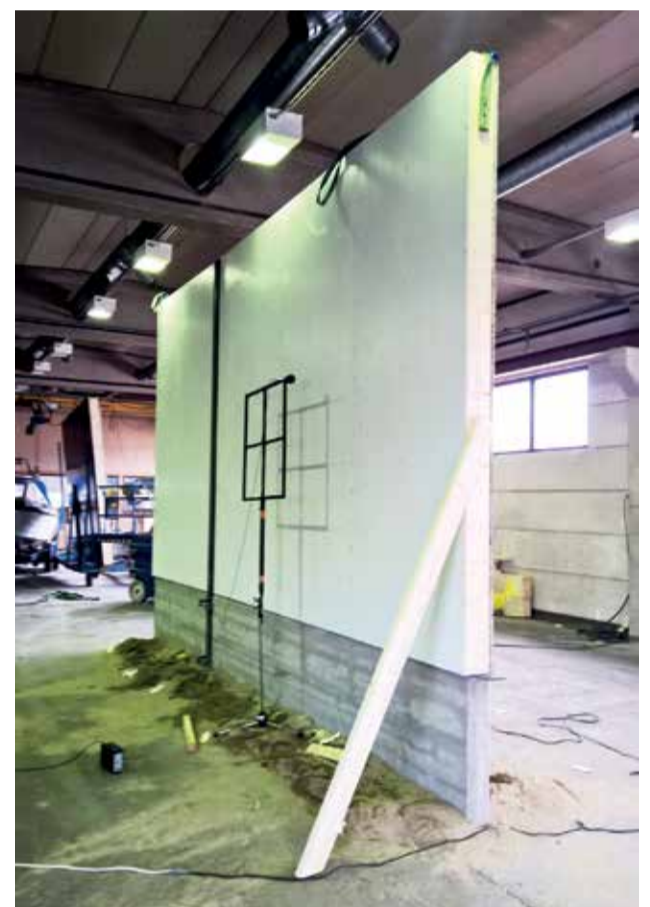
Melutestaus käynnissä. Materiaalina kaikissa Sepan tuotteissa on kotimainen kuusi, joka ekologisempi kuin kestopuu.

Aika on rahaa, ja siksi Sepa tarjoaa kustannustehokkaan ratkaisun myös melusteissa hintapilarivälin taloudellisella kilpailukyvyllä.